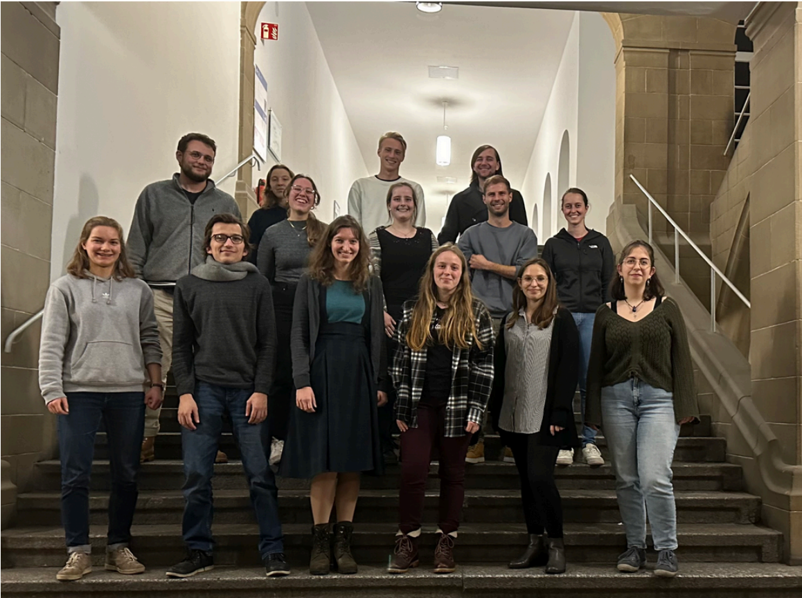
Der Lehramtsrat 2023/24

Falls ihr gerne im Lehramtsrat mitarbeiten möchtet, könnt ihr uns gerne per Mail kontaktieren oder kommt bei einer unserer Sitzungen vorbei. Sprecht uns hierfür gerne per Insta oder per Mail an. :)